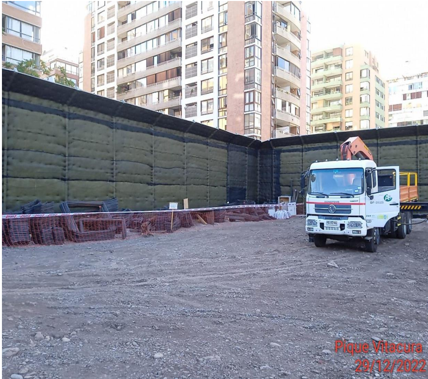
Aumento altura cierre oriente y sur mediante instalación de viseras (altura total aprox. 5,85 m)