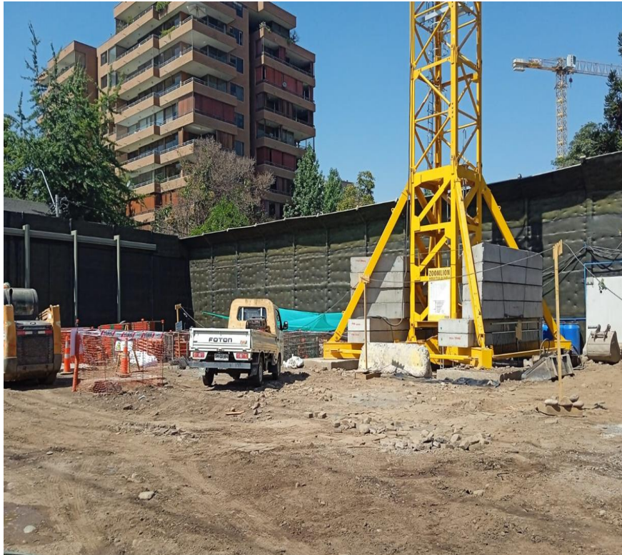
instalación de Grúa Torre – motor eléctrico con mínima emisión de ruido