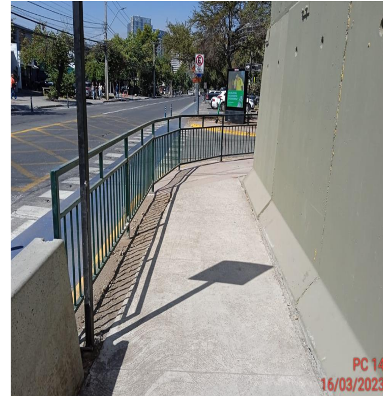
Instalación vallas peatonales A.Córdova c/ El Matico