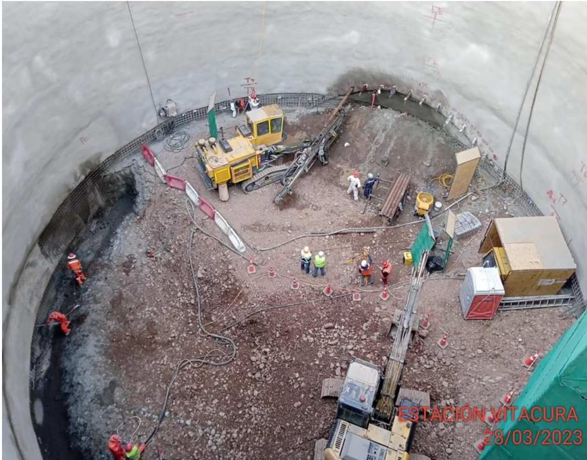
Actividad: perforación tubos paraguas en la clave de galería principal