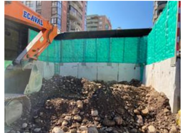
Mejora de barrera acústica en sector carga de marina en superficie