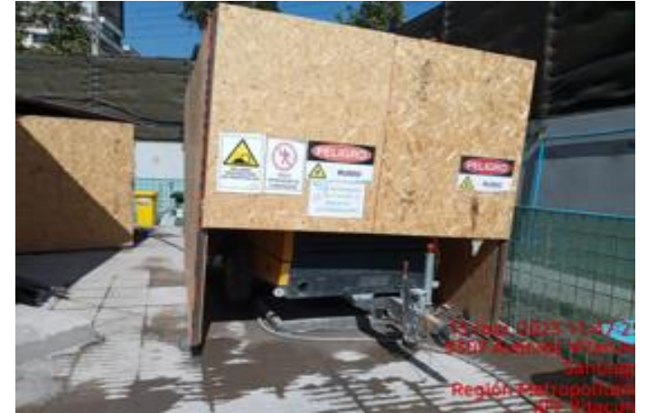
Mejora barrera acústica móvil compresor de aire