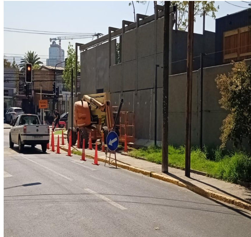
Término de cierre II.FF hacia Las Nieves